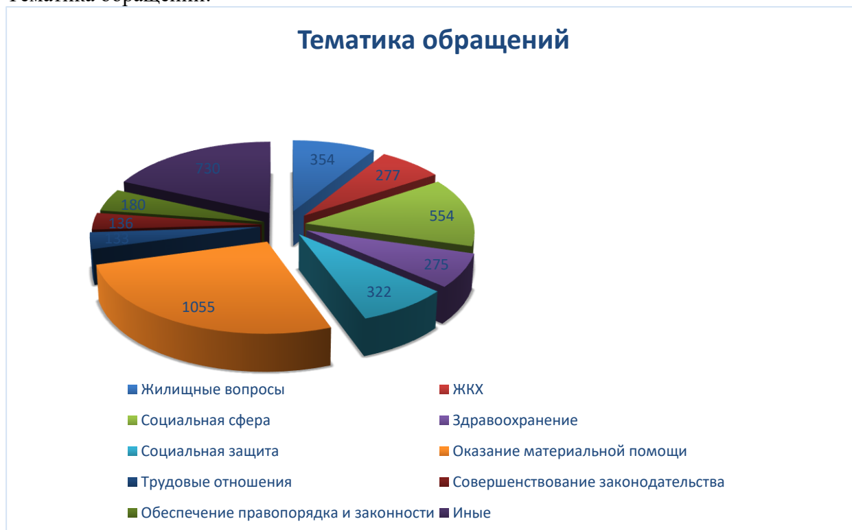
Диаграмма классификации обращений по тематике затронутых вопросов. В диаграмме отражены показатели, имеющие наибольший удельный вес.

Наибольшее количество обращений поступило из городов Нижневартовска, Сургута, Ханты-Мансийска, Нефтеюганского района.