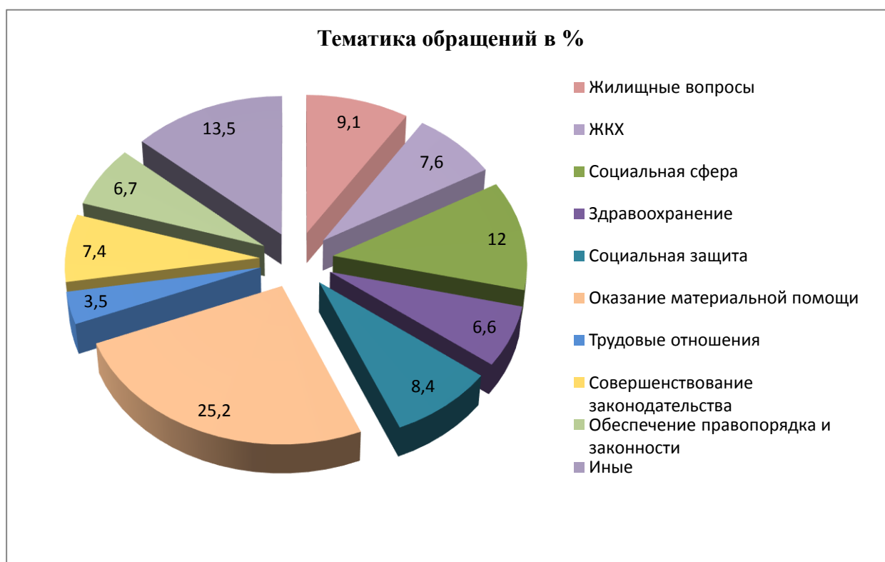
Диаграмма классификации обращений по тематике затронутых вопросов. В диаграмме отражены показатели, имеющие наибольший удельный вес.

Распределение поступивших за отчетный период обращений по территориям: