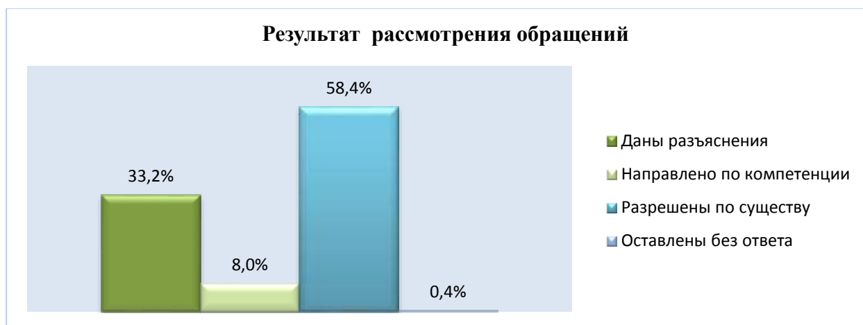
Диаграмма классификации обращений по результату рассмотрения.

98,59% обращений рассмотрены депутатами в течение 30 дней – основной срок, предусмотренный законом от 2 мая 2006 года № 59 ФЗ для рассмотрения обращений, 1,4% обращений рассмотрены с продлением срока.