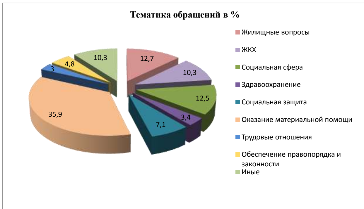
Диаграмма классификации обращений по тематике затронутых вопросов. В диаграмме отражены показатели, имеющие наибольший удельный вес.

Распределение поступивших за отчетный период обращений по территориям: