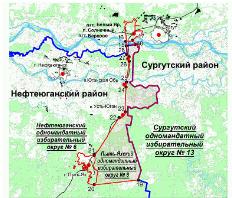
Схема части межселенных территорий Сургутского и Нефтеюганского районов, входящих в Пять-Яхский одномандатный избирательный округ N 8

"Схема части межселенных территорий Сургутского и Нефтеюганского районов, входящих в Пять-Яхский одномандатный избирательный округ N 8"