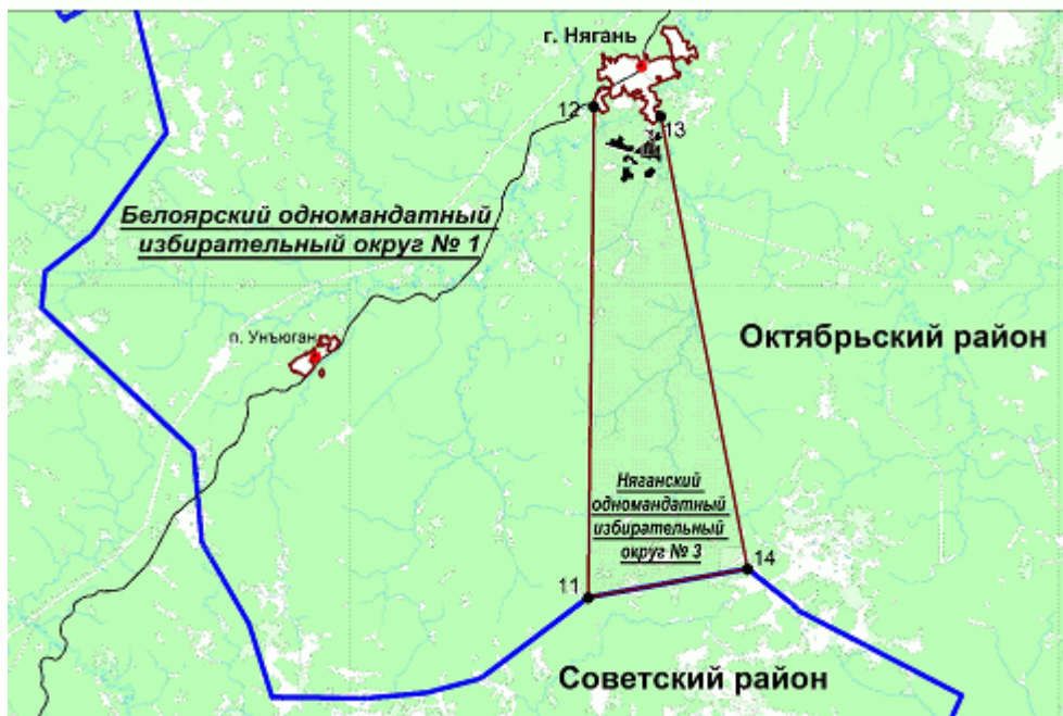
"Схема части межселенной территории Октябрьского района, входящей в Няганский одномандатный избирательный округ N 3"