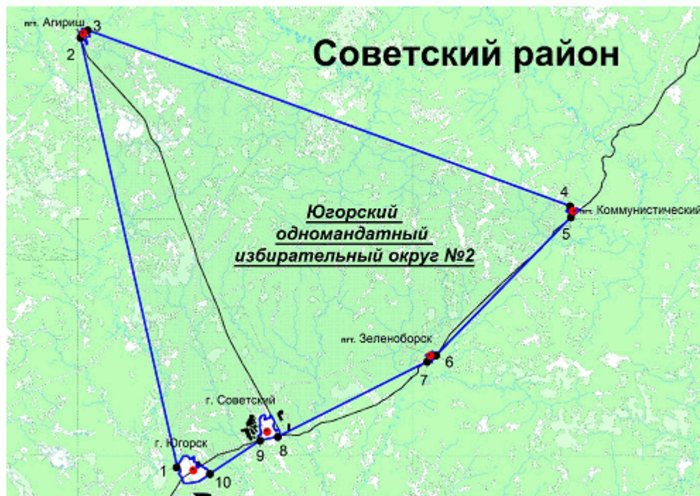
"Схема части межселенной территории Советского района, входящей в Югорский одномандатный избирательный округ N 2"