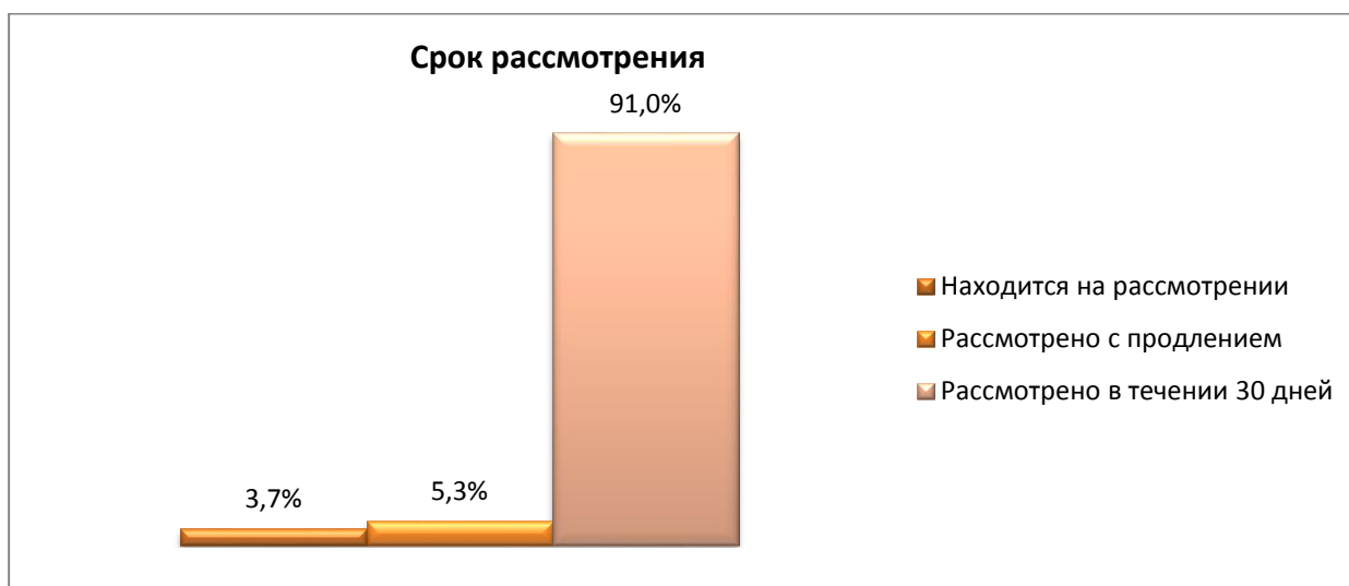
Диаграмма классификации обращений по срокам рассмотрения.

Рассмотрено с продлением срока 249 (5,3 %) обращений.